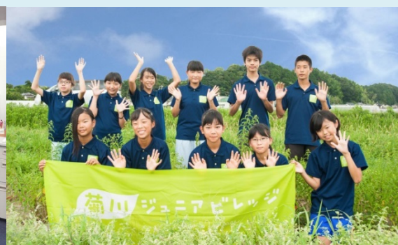
菊川ジュニアビレッジ

農業系の大学を卒業後、東京のIT会社に就職。農業に関わる仕事に携わりたく菊川市に移住し、エムスクエア・ラボに入社。現在は、主に農産物の物流システム「やさいバス」の管理を担っている。