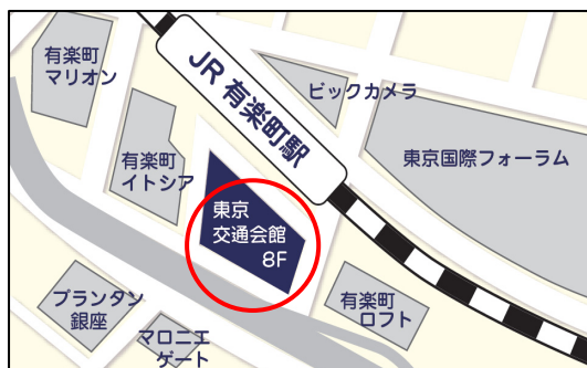
JR山手線・京浜東北線 有楽町駅徒歩1分

東京交通会館 8階 NPOふるさと回帰支援センター (東京都千代田区有楽町2-10-1)