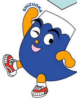
静岡県イメージキャラクター ふじっぴー

静岡は大阪から新幹線(ひかり)で110分 “静岡が好き”な方はもちろん “富士山を見ながら暮らしたい” “今の暮らしを変えたい” “地方で暮らしたい” そんな気持ちに移住相談で形にしませんか。