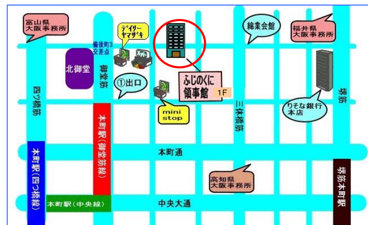
地下鉄御堂筋線本町駅から北西へ200m(徒歩5分)

お申し込みは原則メールで、氏名・年齢・住所・電話番号・その他（相談したいこと・知りたいこと等）を記入の上、開催日の2日前までに上記メールアドレスへお送りください。