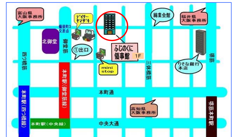
地下鉄御堂筋線本町駅から北西へ200m(徒歩5分)

お申し込みは原則メールで、氏名・年齢・住所・電話番号・希望日時・その他（相談したいこと等）を記入の上、開催日の2日前までに上記メールアドレスへお送りください。