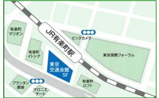
JR山手線・京浜東北線 有楽町駅徒歩1分

東京交通会館8階 NPOふるさと回帰支援センター (東京都千代田区有楽町2-10-1)