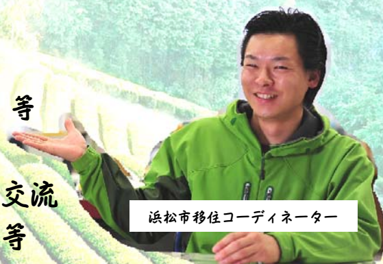
浜松市移住コーディネーター