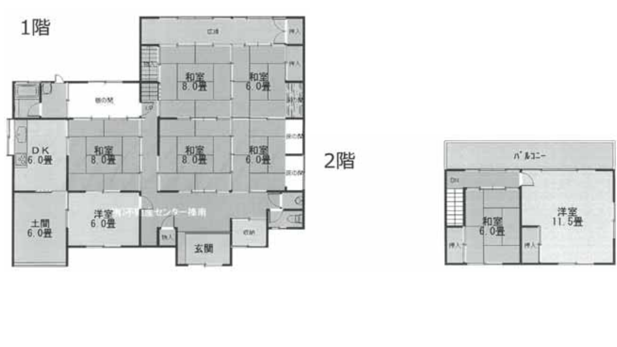
(12) 写真 ①母屋