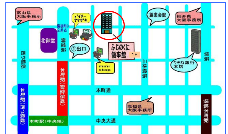
地下鉄御堂筋線本町駅から北西へ200m(徒歩5分)

お申し込みは原則メールで、氏名・年齢・住所・電話番号・希望日時・その他（相談したいこと等）を記入の上、開催日の1週間前までに上記メールアドレスへお送りください。