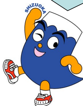
静岡県イメージキャラクター ふじっぴー