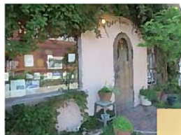
パティスリーフルクワバ? (藤枝市)