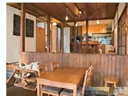
Cafe TeeDa (南伊豆町)