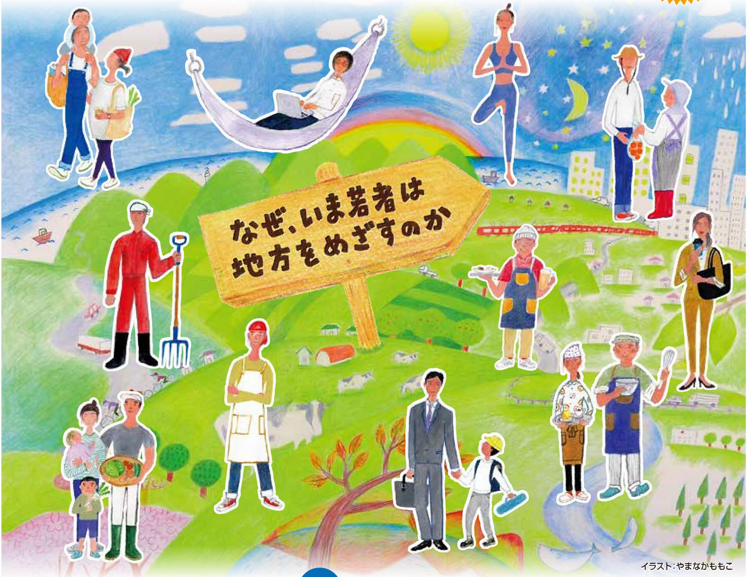
イラスト:やまなかもこ