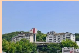
ホテルニュー八景園