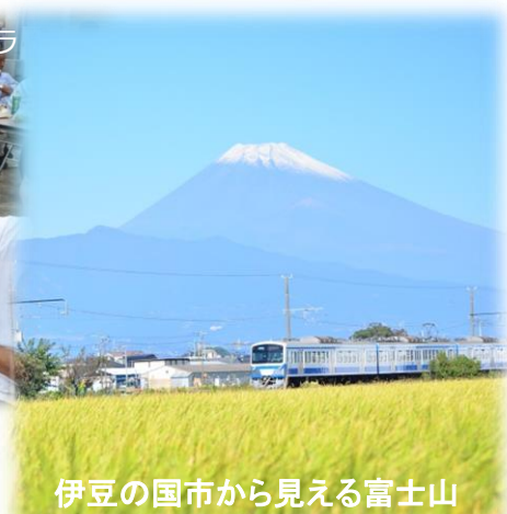
伊豆の国市から見える富士山