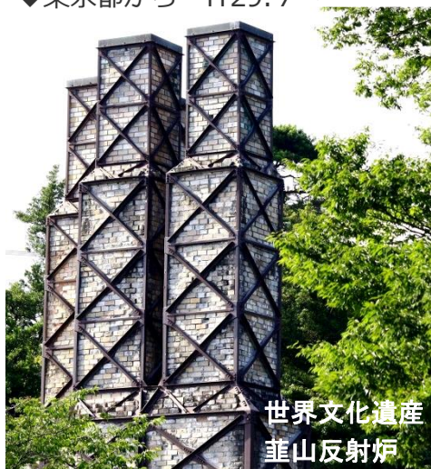
世界文化遺産 蘆山反射炉