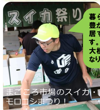
まごころ市場のスイカ・ モロコシまつり!

暮らしやすさと 豊かな自然が同 居するところ です。娘はトマトと 大根が大好きに なりました!