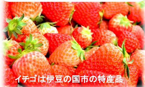
イチゴは伊豆の国市の特産品

暮らしやすさと 豊かな自然が同 居するところ です。娘はトマトと 大根が大好きに なりました!