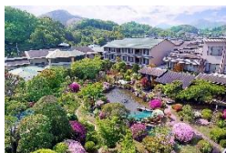
サンバレー伊豆長岡