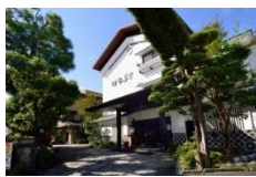
陶芸の宿はなぶさ